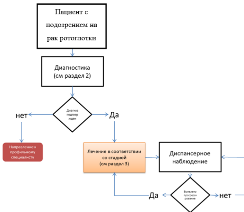
Схема 1. Блок-схема диагностики и лечения больного раком ротоглотки